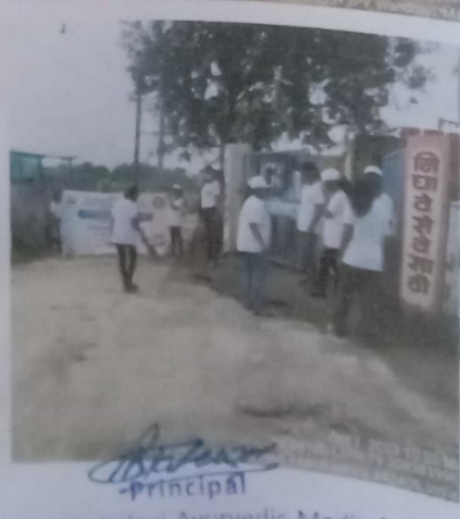
Smt. Vimladevi Ayurvedic Medical College & Hospital, Chandrapur